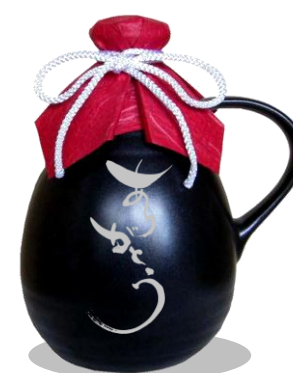
720mLデキャンタボトル(黒マット釉)