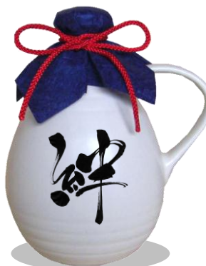
720mLデキャンタボトル(白マット釉)