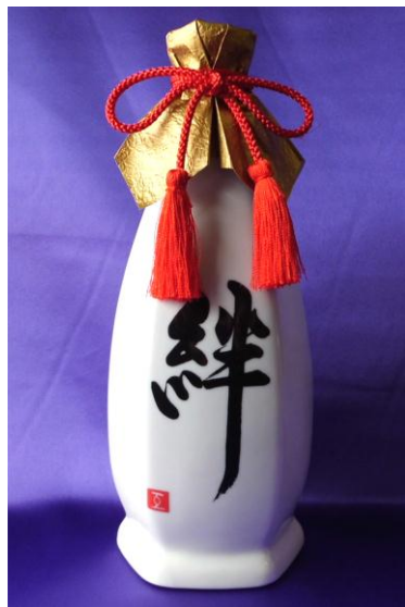
透明釉+2色転写見本